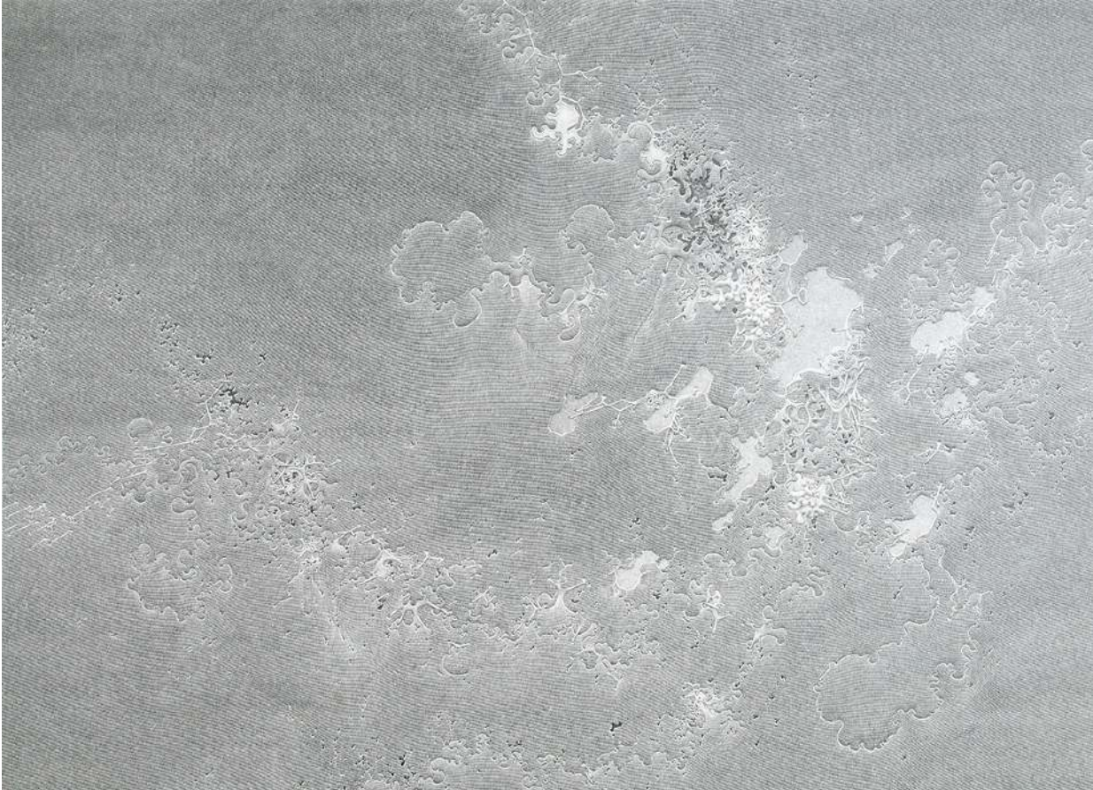
Polymorphic Reservoir , 2013 Grafito sobre papel y base de madera 114 x 152 cm