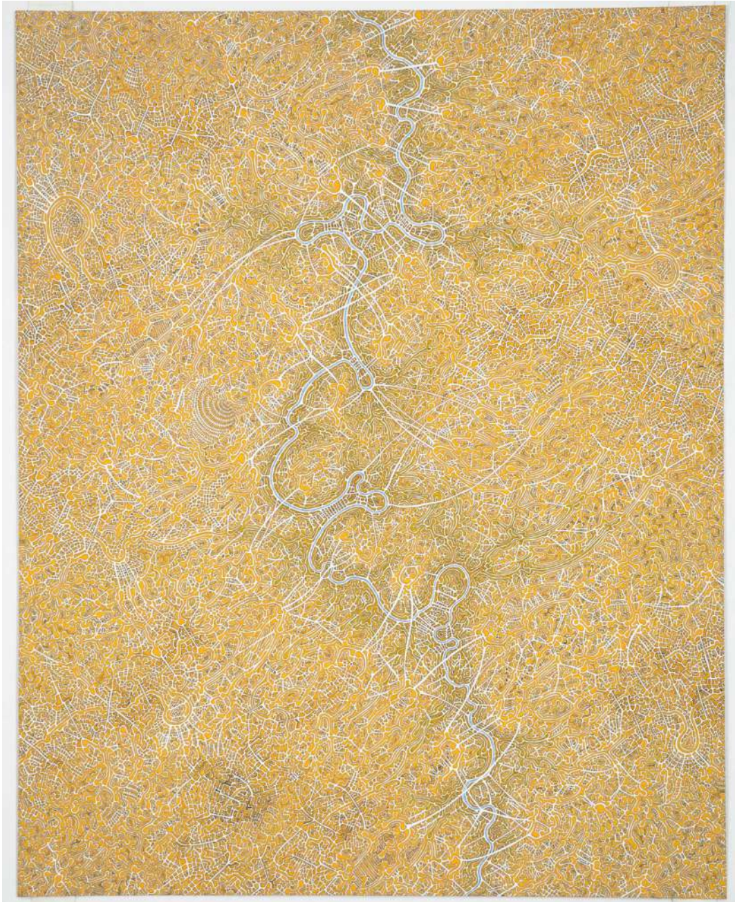
Foregone Conclusion , 2018 Tinta y acrílico sobre papel 50.8 x 40.4 cm