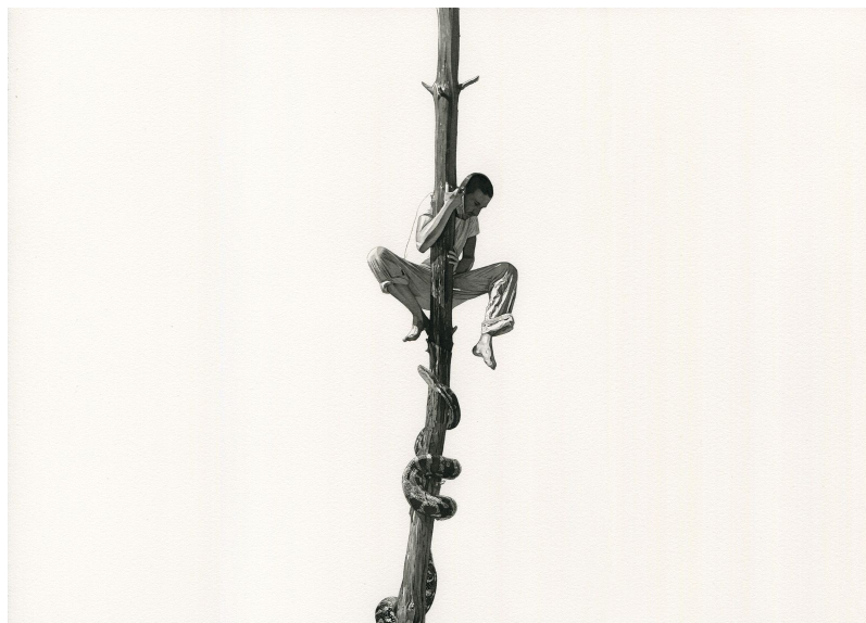
Serpent, 2017 Ink and watercolor on paper 30 x 42 cm

En Serpent 2017 , como una imagen de pesadilla, el artista se representa “escapando” de una serpiente que asciende hacia él sobre un árbol. La simplicidad formal acentúa el dramatismo donde somete a sus personajes a batallas psicológicas propias del subconsciente. Estas situaciones extremas dibujadas sobre papel, reflejan las preocupaciones y temores de Mérelle, un artista atento a que el “lenguaje corporal” pueda ser sentido por el espectador.