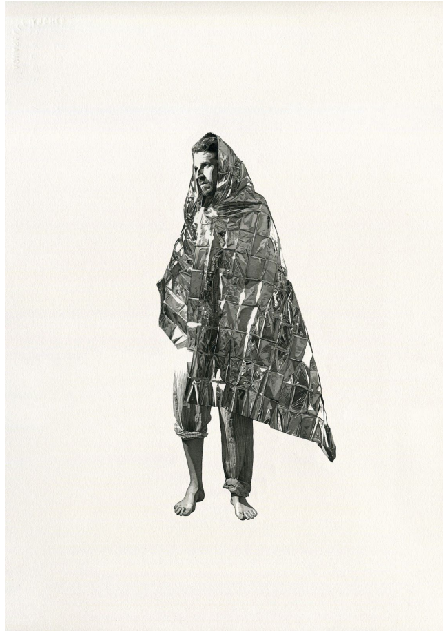
Sous un manteau de novembre, 2017